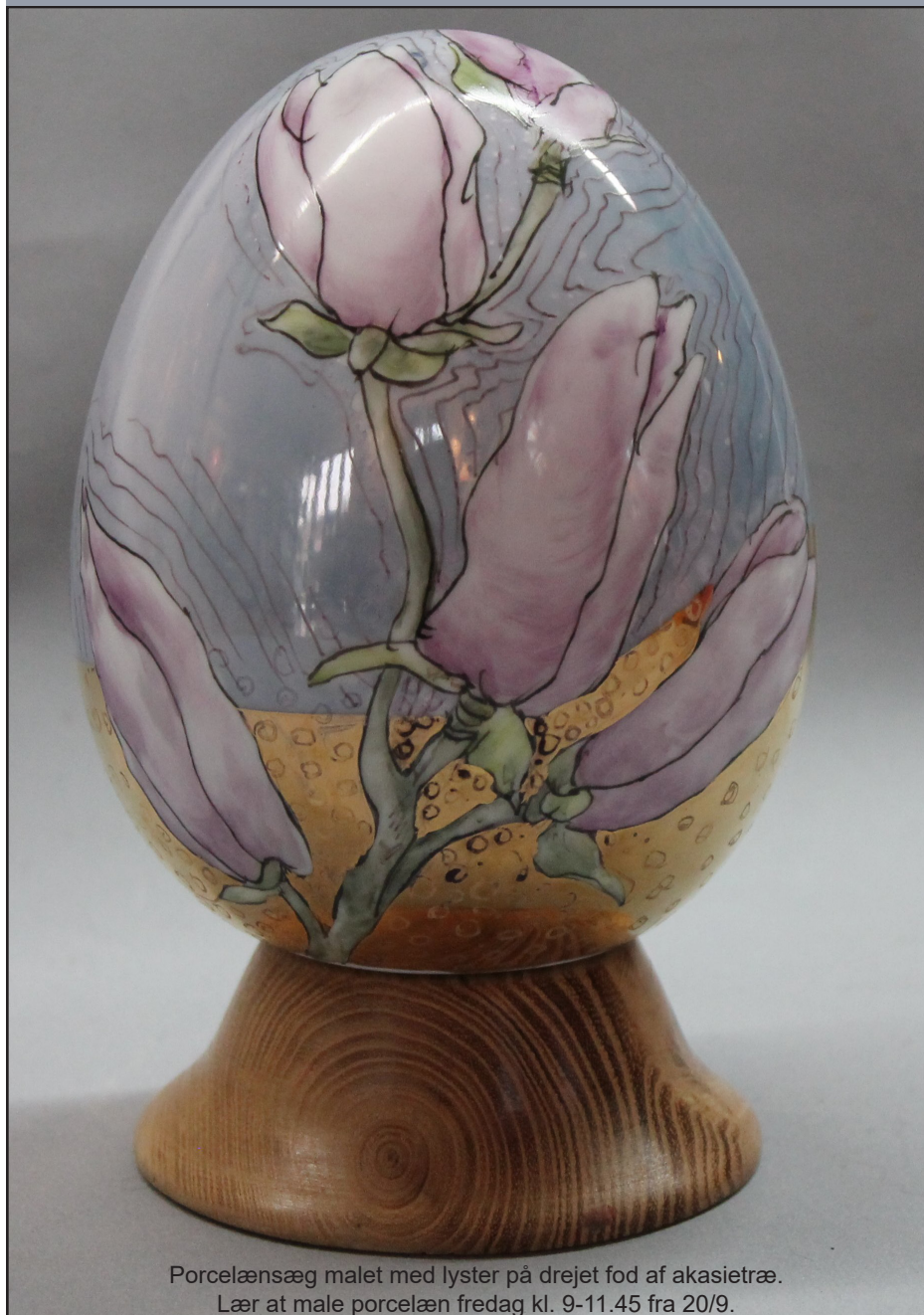
Porcelænsæg malet med lyster på drejet fod af akasietræ. Lær at male porcelæn fredag kl. 9-11.45 fra 20/9.